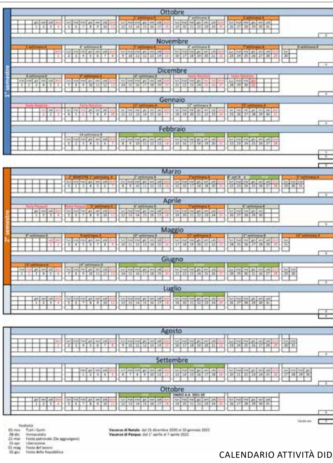
CALENDARIO ATTIVITÀ DIDATTICHE